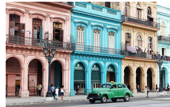
La Habana Vieja

Havanna wurde im Jahr 1519 aufgrund der strategisch günstigen Lage von den Spaniern gegründet. Seit dem Jahr 1982 ist die Altstadt von Havanna (La Habana Vieja) UNESCO-Weltkulturerbe.