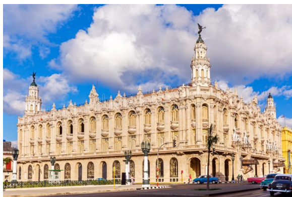
Gran Teatro Havana