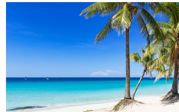
Strand in Varadero

Varadero ist der bekannteste Badeort Kubas und liegt ca. 140 km von Havanna entfernt auf der Halbinsel Hicacos. Die schmale Landzunge ragt in den Atlantischen Ozean und bietet flach abfallende Sandstrände, geschützt durch vorgelagerte Riffe.